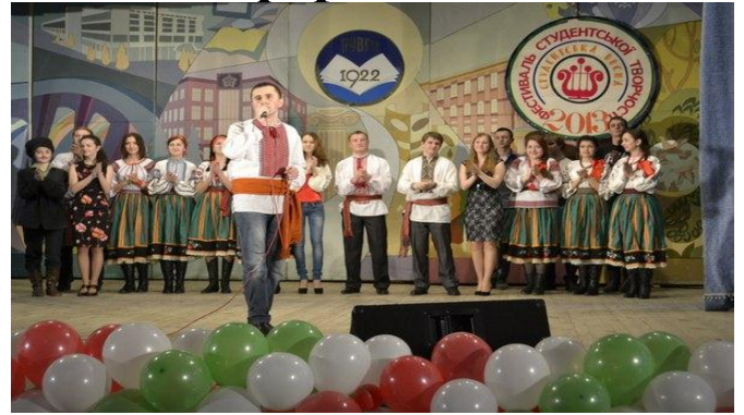
Творчий колектив ФЗГ

Дякуємо студентам, які організували це дійство за цікаві номери та щирі посмішки. А побачити як це було Ви можете переглянувши фото.